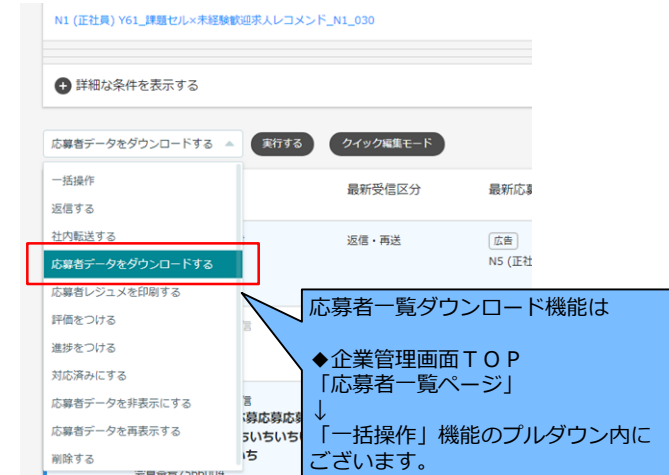
【応募者一覧データのダウンロードの項目追加になる箇所】